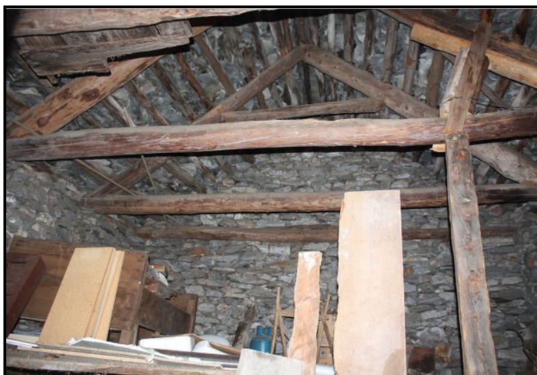
Sotto tetto / Dachgeschoss