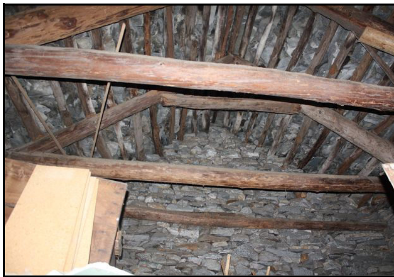
Sotto tetto / Dachgeschoss