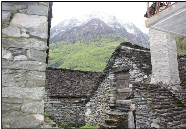
Vista sud / Südblick