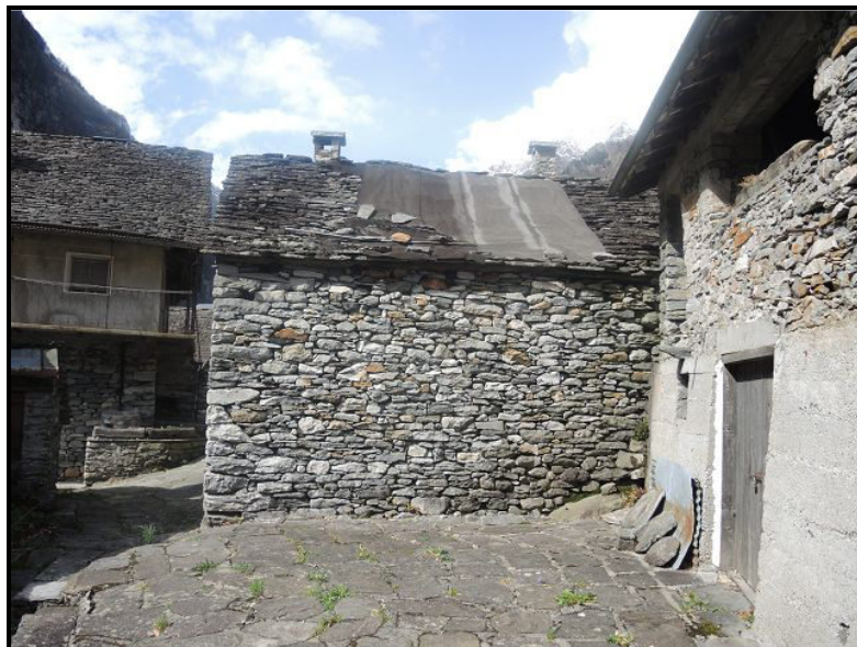
Facciata sud / Südfassade