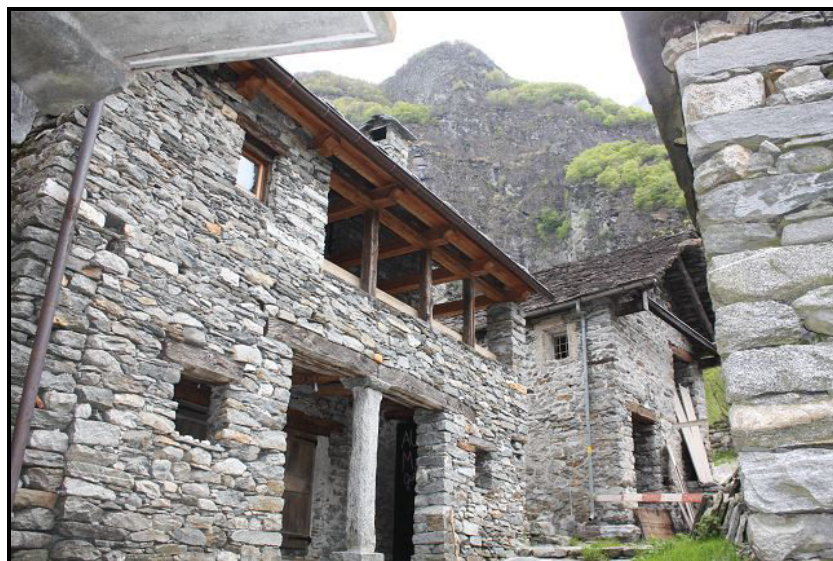
Vista est / Westblick