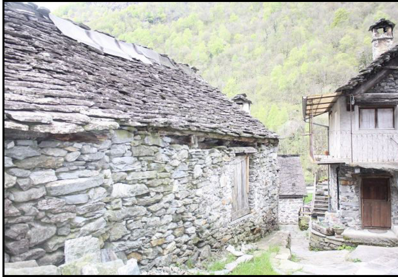
Vista sud-ovest / Südwestblick