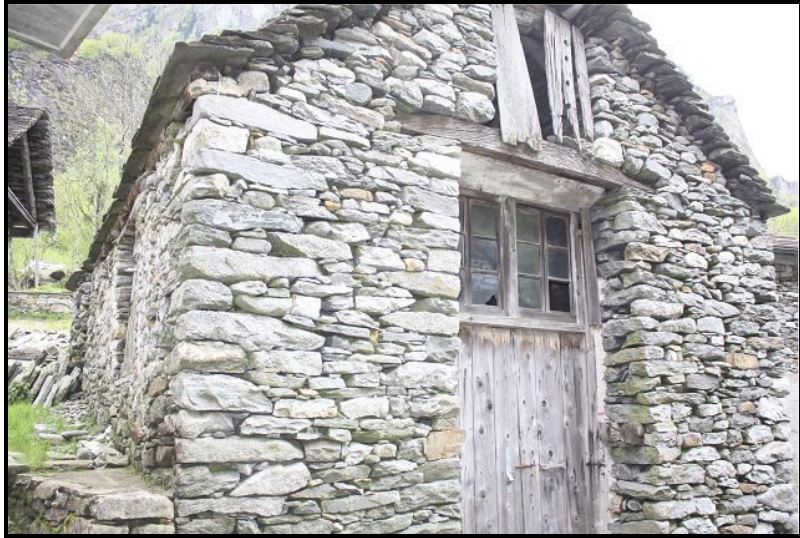
Entrata / Eingang