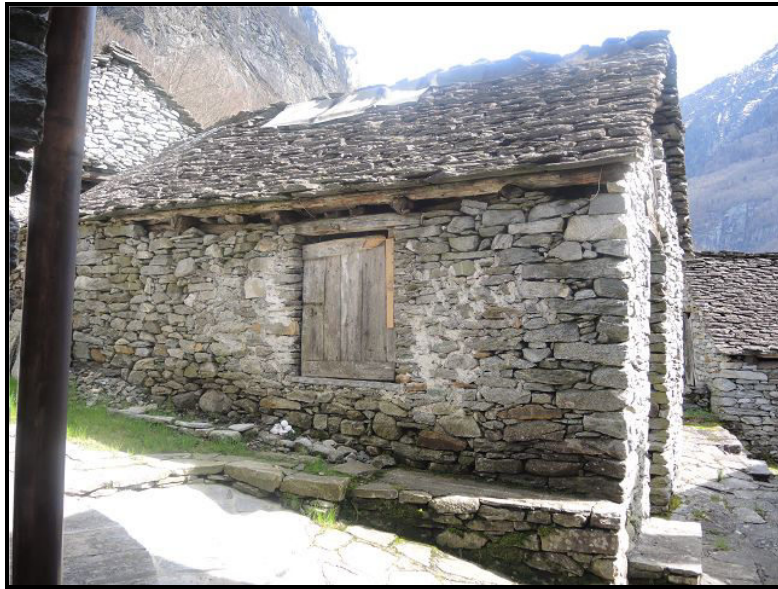
Facciata nord / Nordfassade