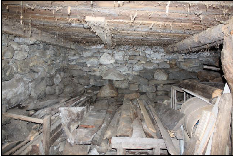
Piano terra / Erdgeschoss